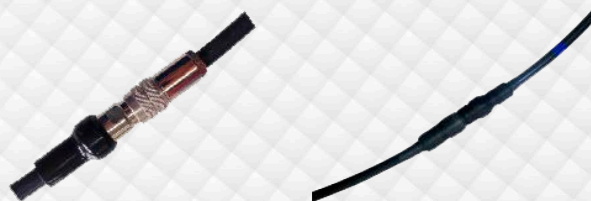
Errado (sem isolamento)

A) Caso seja necessário o uso de "jumpers", para interligar as antenas ao DPO, isole completamente os conectores.